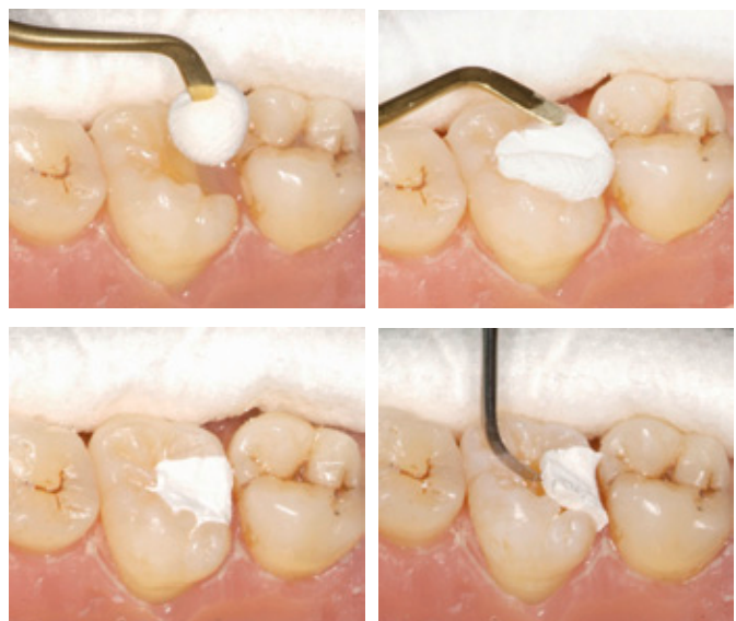
Eén component, zonder mengen. Goede hechting in de caviteit. Makkelijk te verwijderen.