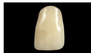
Gaenial Anterior (GC)