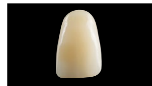
Herculite XRV Ultra (Kerr)