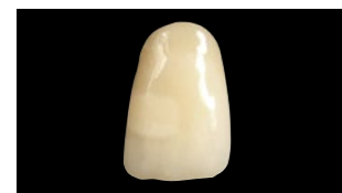
Amelogen Plus (Ultradent)