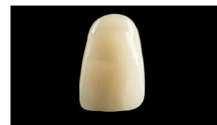
Charisma – Oud