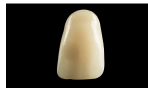
Z100 (3M Espe)