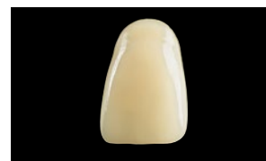
Charisma – Nieuw

Het geheim achter de intens natuurlijke look: Charisma's ideale kleurgelijkheid maakt 1 kleur laagtechnieken nog gemakkelijker.